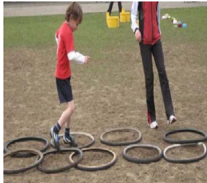
Sfeerbeelden van een wriemeldag voor onze jongste korfballers

Dit is in principe een grote kriebelles die zal doorgaan op de korfbalvelden op de Zeurt. Meer informatie volgt nog, maar hou deze datum alvast vrij.